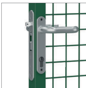
Serrure à monter dans le cadre, en inox, et poignées en aluminium