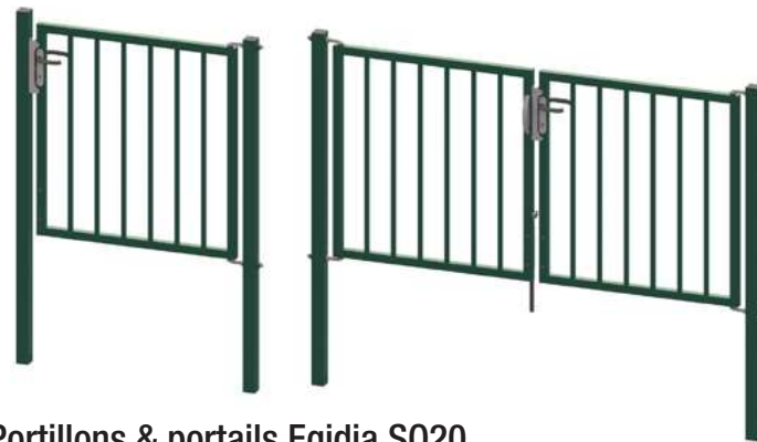
Portillons & portails Egidia SQ20

Betafence est le leader mondial du marché des solutions de clôture, de contrôle d'accès et de détection pour la protection périmétrique. Toutes les sociétés Betafence et les noms de produits sont des marques déposées de PRÆSIDIAD Group Limited. Les modifications apportées aux produits et à l'assortiment sont susceptibles d'être modifiées sans préavis.