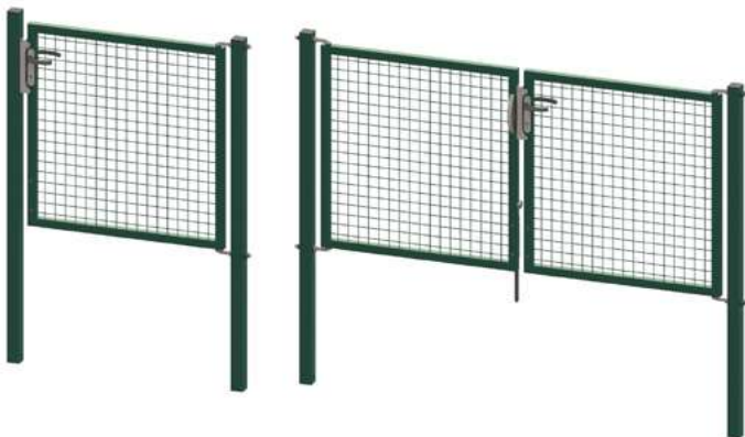
Portillons & portails Egidia M50