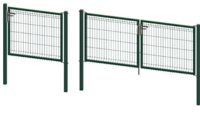
Portillons & portails Egidia N3D