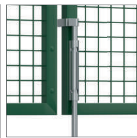
Guide et béquille fournis pour tous les portails 2 vantaux