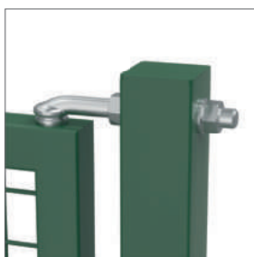
Gonds rigides, M16 (160 ou 180 mm) faciles à régler, en acier galvanisé