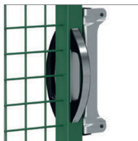
Poignée aluminium pour le vantail béquille des portails (modèles à 2 vantaux uniquement)