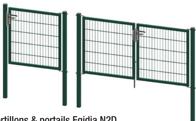
Portillons & portails Egidia N2D